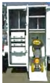
Pil'Up Ascenseur à pilonneuse