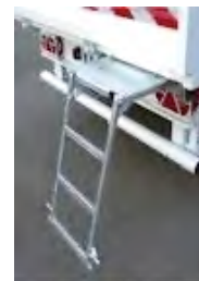
Escalier escamotable benne