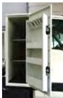
Étagères de porte