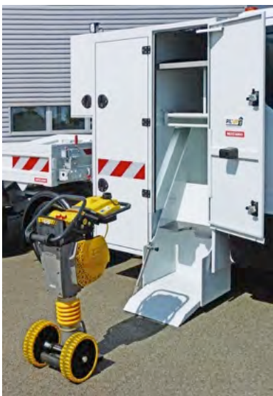
Coffre Pil'Up l'ascenseur à pilonneuse

Nous vous proposons de découvrir cette gamme complète, disponible chez Maxicargo ou chez votre carrossier partenaire.