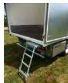
Echelle escamotable fourgon