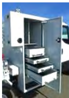
Tiroirs de coffre