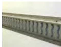
Rails, capitons, cornières d'arrimage