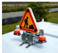
Gyrophares Led et Triflash