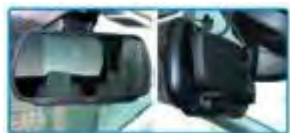
Caméra de recul sur rétroviseur intérieur (en standard)