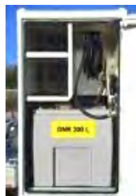
Cuve EAU ou GNR avec enrouleur 8 m