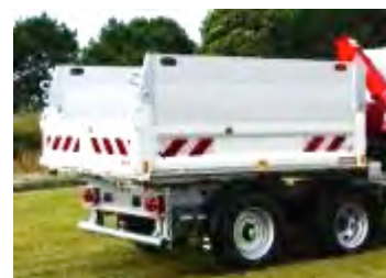
Rehausses de ridelles