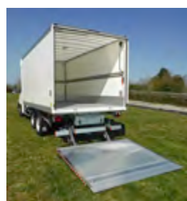
Hayon rabattable Dhollandia DHLMA.10