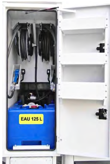
Cuve EAU avec enrouleur