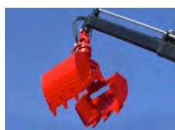
Grue avec treuil / rotator / godet preneur