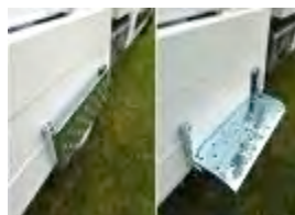
Marchepied intérieur ridelle de benne