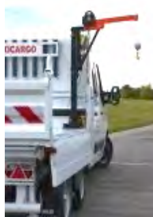
Potence dans la benne