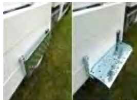
Marchepied intérieur ridelle de benne