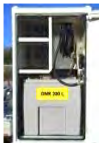
Cuve EAU ou GNR avec enrouleur 8 m