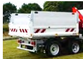
Rehausses de ridelles