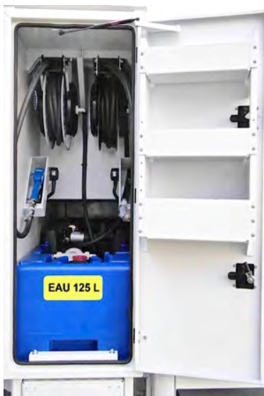
Cuve EAU avec enrouleur