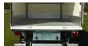
Aménagements lavable (plancher alu polyuréthane, plinthes alu, bonde évacuation, ventilation)