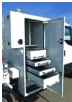
Tiroirs de coffre